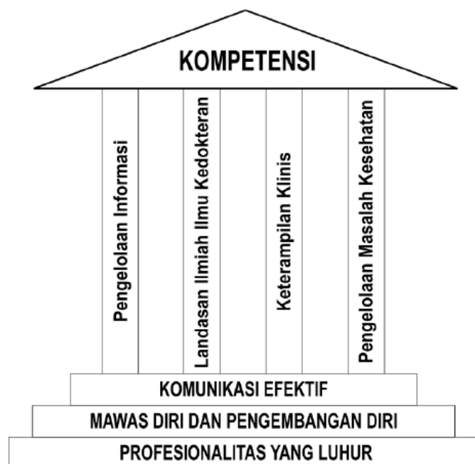
Gambar 2. Pondasi dan Pilar Kompetensi.